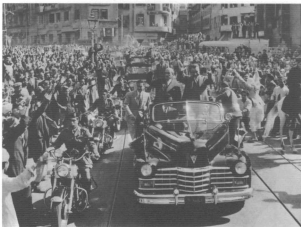
عبد الناصر مع القوتلي في سوريا